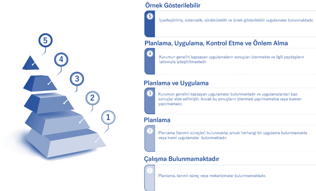
Şekil 1. YÖKAK Dereceli Değerlendirme Anahtarıyla Alt Ölçütlerin Olgunluk Düzeyinin Değerlendirilmesi

• YÖKAK Dereceli Değerlendirme Anahtarı'nda her bir alt ölçüt için kalite güvencesi süreç ya da mekanizmaları; PLANLAMA, UYGULAMA, KONTROL ETME VE ÖNLEM ALMA (PUKÖ) basamaklarının olgunluk düzeyleri dikkate alınarak tanımlanmış olup, 1-5 arasındaki bir ölçekle derecelendirilmiştir. Bu anahtarla olgunluk düzeyi belirlenen alt ölçütler, ilgili ölçütlerin karşılanma düzeyini ortaya koymaktadır. Alt ölçütlerin PUKÖ döngüsü ile ilişkilendirilmiş olgunluk düzeyleri Şekil 1'de özetlenmektedir.